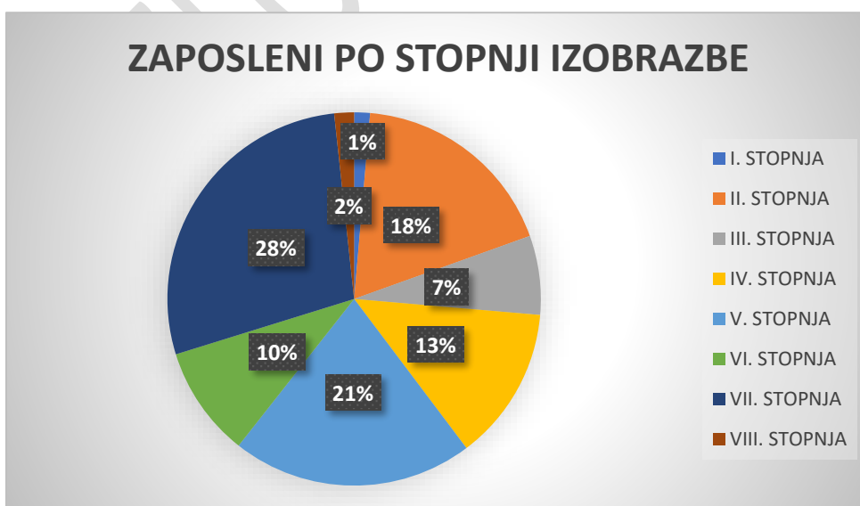
Tabela 3: grafični prikaz zaposlenih glede na stopnjo izobrazbe