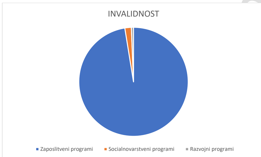
Tabela 4: grafični prikaz zaposlenih po programih glede na število invalidnih oseb z odločbo